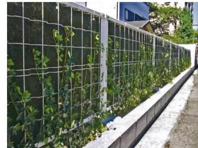
■ヘデラ カナリエンシス