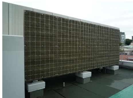
<パネル設置イメージ>