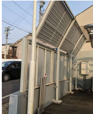
<支柱構造イメージ>