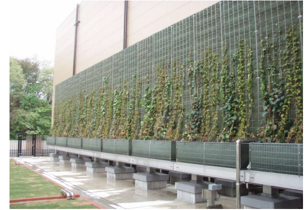
<壁面植栽イメージ>