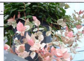
■初雪カズラ (キョウチクトウ科)常緑