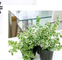
■フィカスピラ (クワ科)半落葉