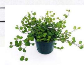
■ワイヤープランツ (タデ科)半落葉