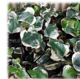
■ヘデラ カナリエンス フ入り(ウコギ科)