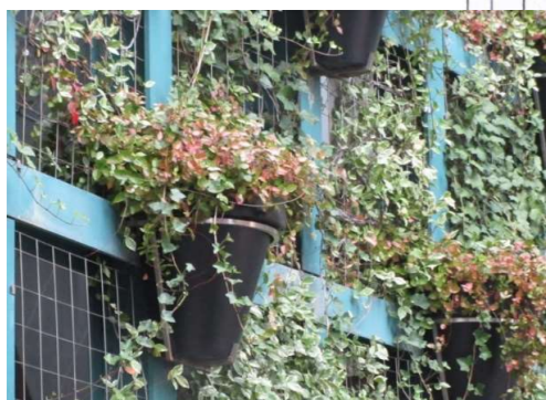
<ヤシマットシステム>