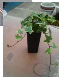
■アイビーヘデラ ヘリックス (ウコギ科)