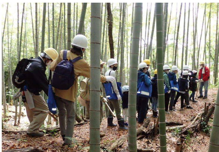
◇ タケノコ掘り体験 モウソウ竹林に行く