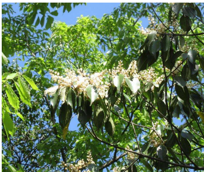
◇ クロバイも満開 南尾根里道