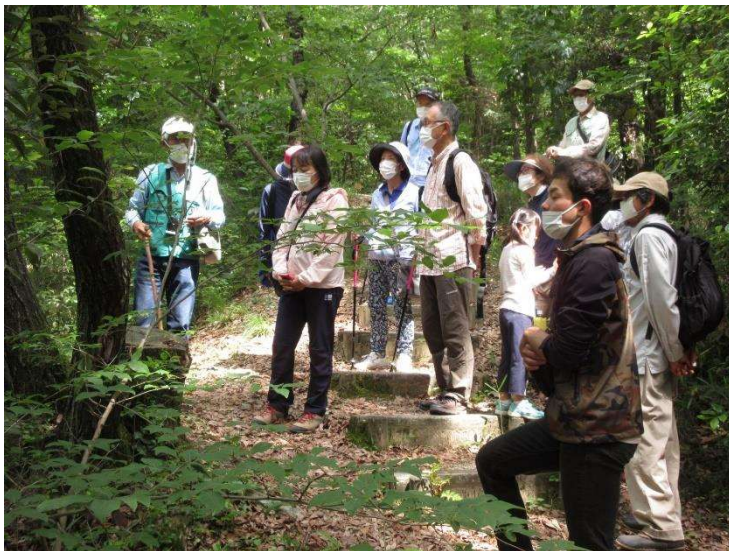
◇ 樹木観察会 モンゴリナラの前で