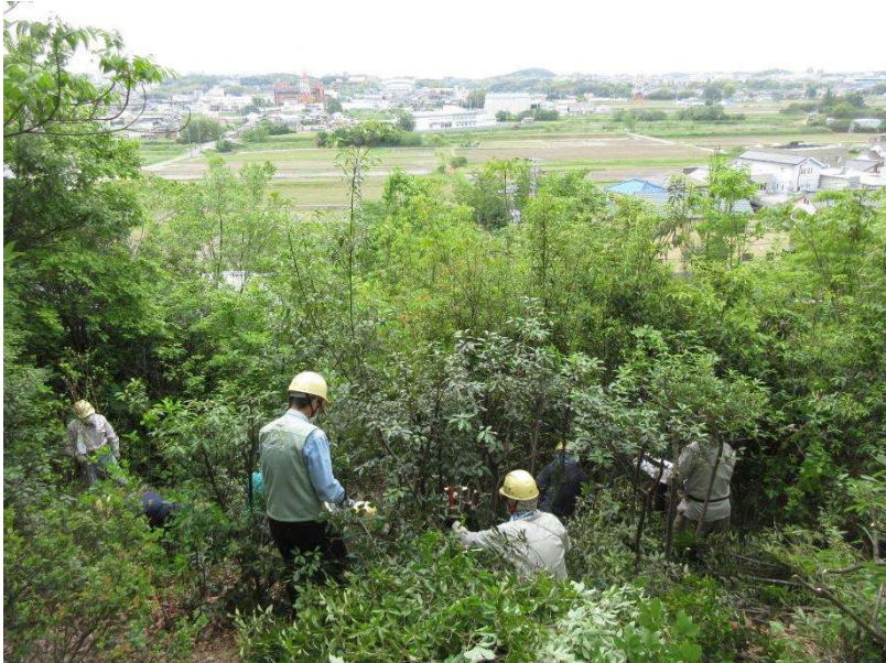
◇ 大崖道展望台 伸びたカシ類伐採し展望回復