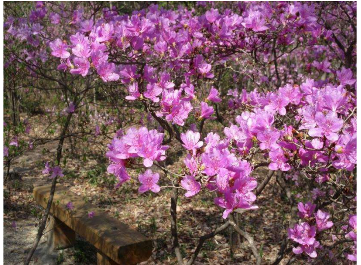
◇ 南尾根里道群落 4月10日