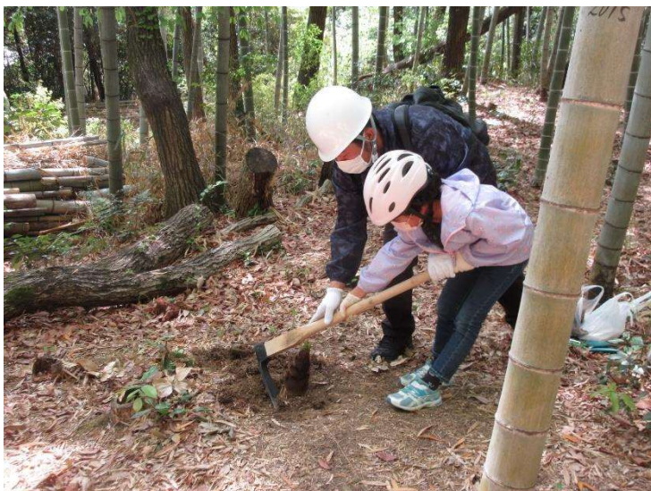
◇ タケノコ掘り体験中 モウソウ竹林