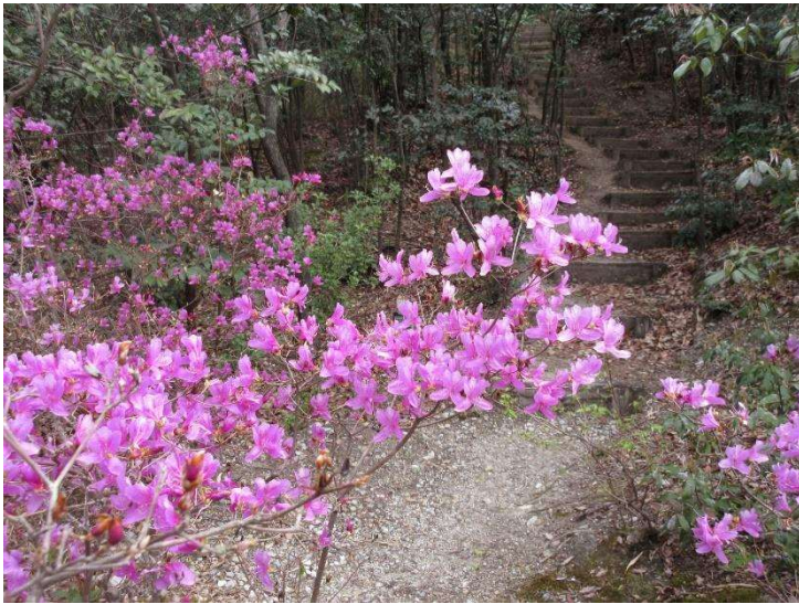
◇ コバノミツバツツジ 大崖道 4月1日