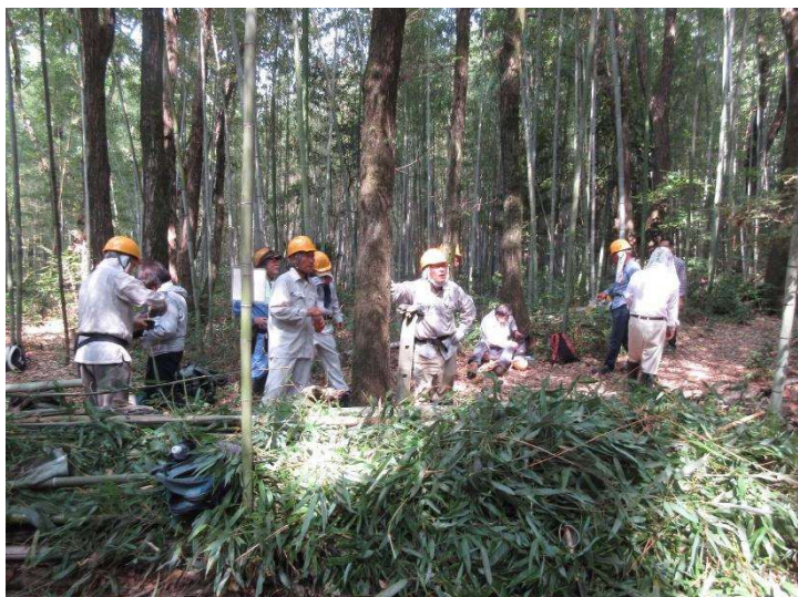
◇ 9月維持管理 マダケ林