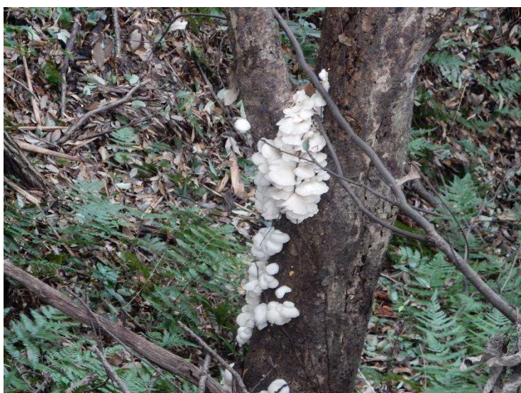
◇ ウスヒラタケ? 群生 コナラの大木階段付近