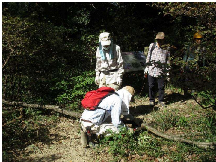
◇ 14号台風で落下した枯れ枝 南入口分岐標識付近