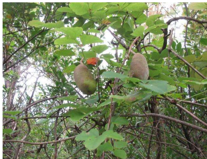
◇ 対で実ったアケビ 南駐車場