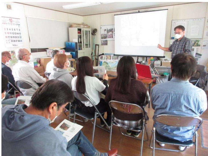
◇ 里山保全実践講座① 大学生が5名出席