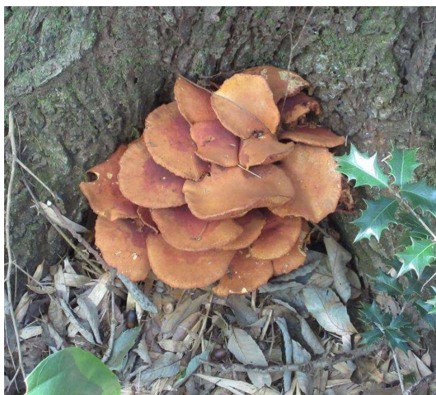
◇ オオワライタケ（大笑茸）の群生 竹林の小径 今年も発生しました、この木の裏側にも発生