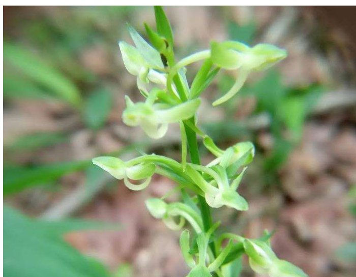
◇ オオバノトンボソウ 南砂防広場で咲く