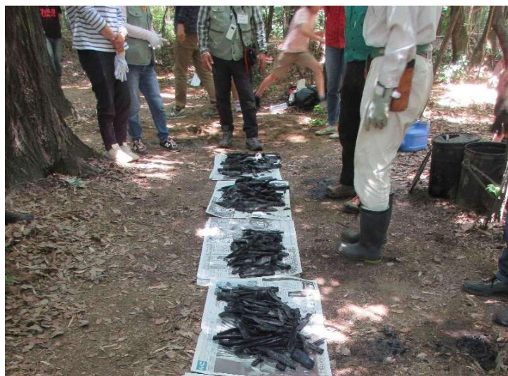
◇焼きあがった竹炭 5班とも良い焼き具合