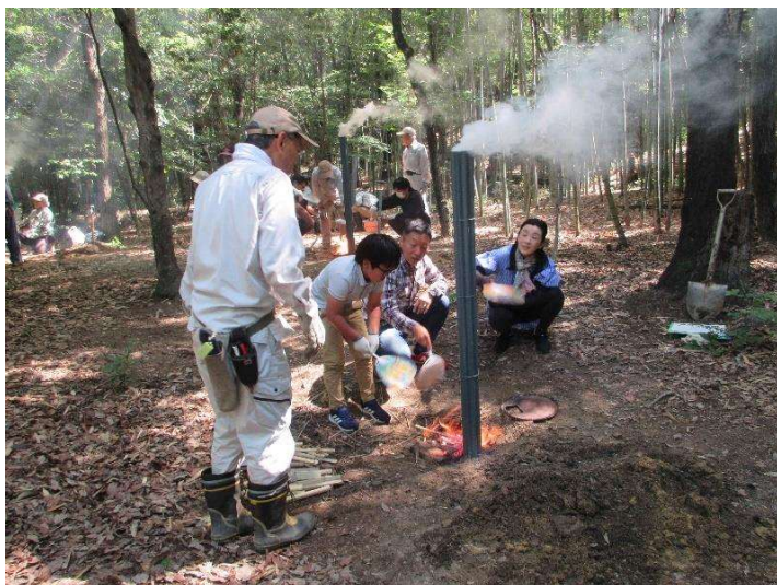
◇ 北高上緑地 竹炭焼き体験