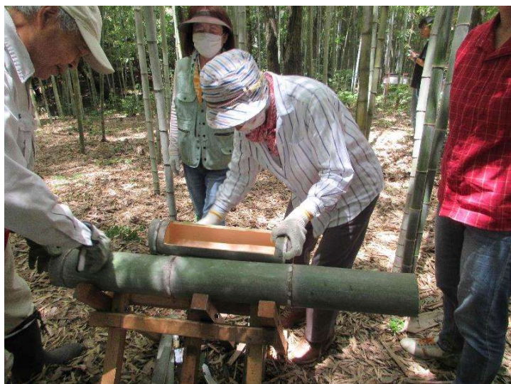
◇ 空いた時間で竹炭入れを作る