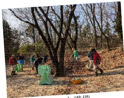
★1/23 イベント準備 落葉のプールのために