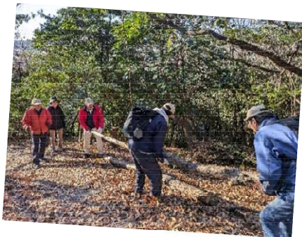
★1/22 巡回 散策路の普請