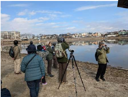
★1/19 堀スクール番外編 牧野ヶ池緑地探鳥