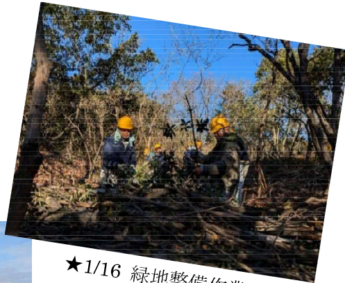
★1/16 緑地整備作業② コバノミツバツツジの 日照確保