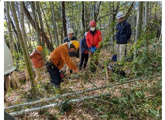
★1/18 里山実践講座③ 竹の枝払い