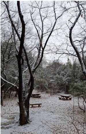
★1/10 西砂防広場 雪化粧