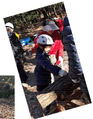
★1/25 シイタケ栽培体験 シイタケ出てくるかなあ～