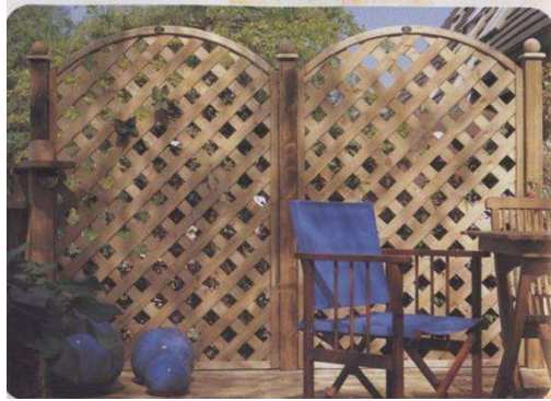
ダイアゴナルアーチパネル