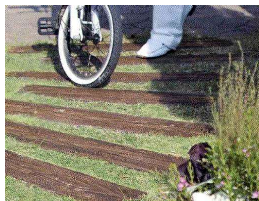
枕木風の擬木を使った小道