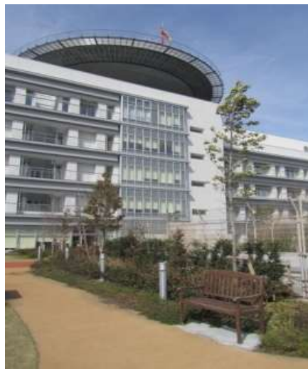
すべりにくい遠路舗装