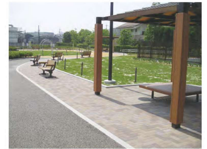
夏の日差しを遮るためのパーゴラ