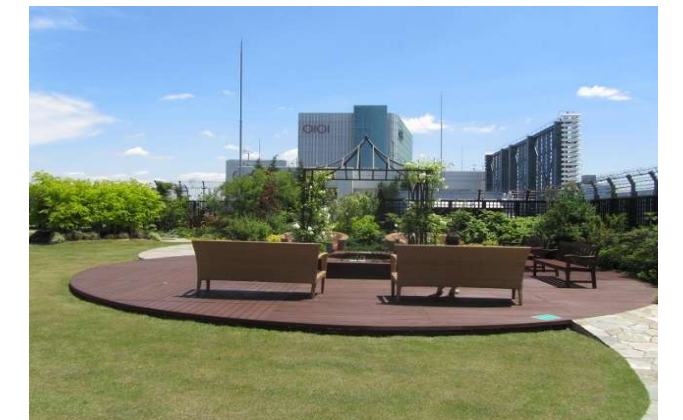
円形樹脂デッキと芝庭