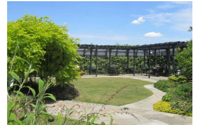
乱形石通路と芝庭 奥がパーゴラ