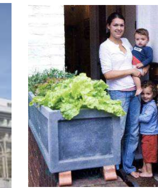
ボックス型ベジタブルガーデン