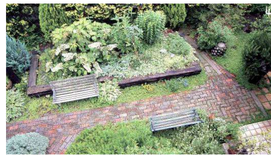
ベジタブルガーデンとレンガ通路