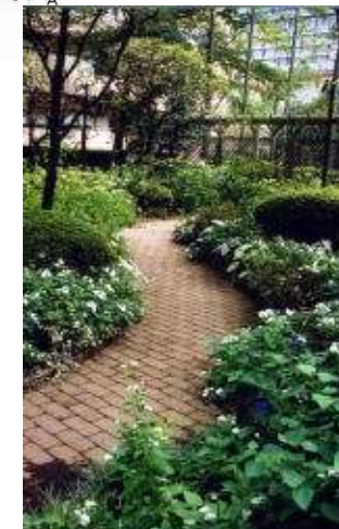
レンガ小道と植栽