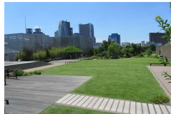
ウッドデッキと芝庭の組み合わせ