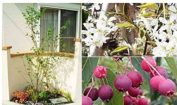
ジュンベリー (バラ科) 落葉