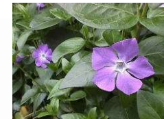
ツルニチニチソウ (キョウチクトウ科)