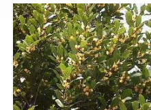
月桂樹(ローリエ) (クスノキ科) 常緑