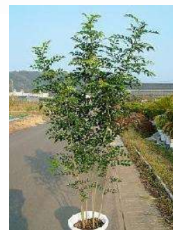
トネリコ (モクセイ科) 常緑