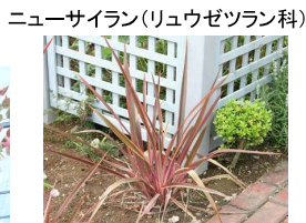
ニューサイラン(リュウゼツラン科)