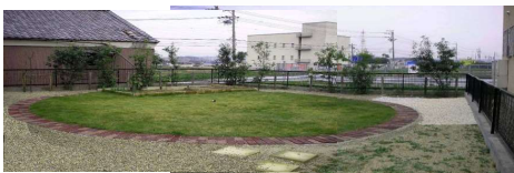
ツボサンゴ (ユキノシタ科) 常緑