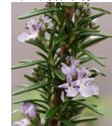
ローズマリー (シソ科) 常緑