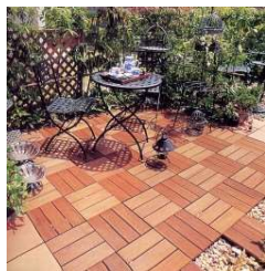
床敷材(セラランガバツ材)

円形の芝は、とても楽しい空間に。植栽は、樹木や地被植物などを組み合わせて、ナチュラルな感じの植え込み方法。屋上にいながら、緑を楽しむことができます。