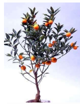
きんかん (ミカン科) 常緑