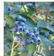
ブルーベリー (バラ科) 落葉