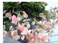
初雪カズラ (キョウチクトウ科) 常緑