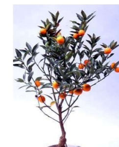
きんかん (ミカン科) 常緑