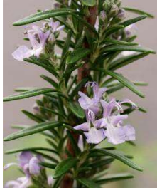
ローズマリー (シソ科) 常緑