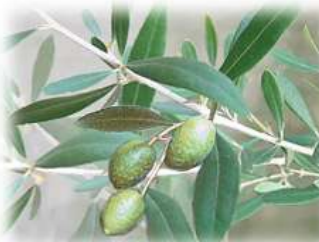
オリーブ (モクセイ科) 常