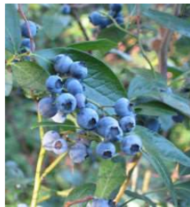
ブルーベリー (バラ科) 落葉