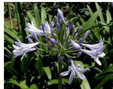
アガパンサス (ユリ科) 常緑