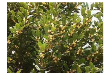
月桂樹(ローリエ) (クスノキ科) 常緑