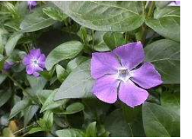
ツルニチニチソウ (キョウチクトウ科)