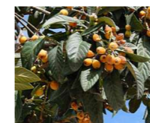
ビワ (バラ科) 常緑