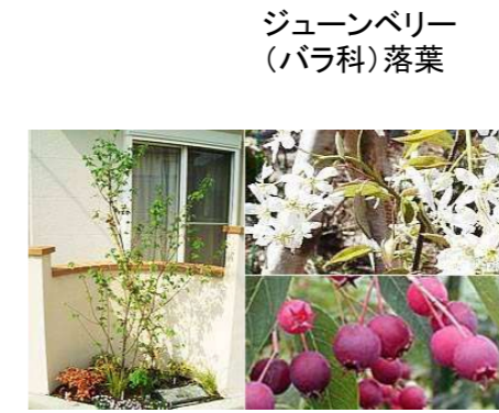
ジュンベリー (バラ科) 落葉