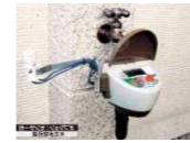
自動灌水用タイマー グローベン