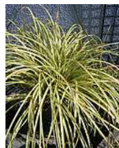
ベアグラス (カヤツリグサ科 常緑多年草)