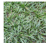
玉竜 (ユリ科)常緑宿根草