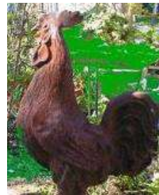
ペアにわとり ¥28,000 錆びた風合いが渋い鶏