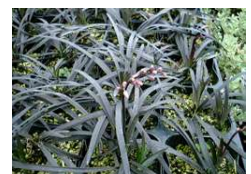
黒竜 (ユリ科常緑多年草)