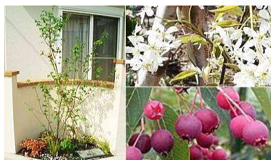
ジュンベリー (バラ科)落葉