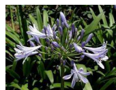
アガパンサス (ユリ科)常緑