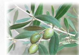
オリーブ (モクセイ科)常緑