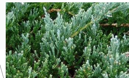
(ハイバクシン ヒノキ科 常緑針葉樹)