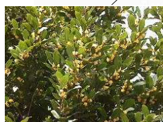
月桂樹(ローリエ) (クスノキ科)常緑