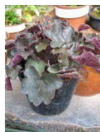
ツボサンゴ (ユキノシタ科)常緑