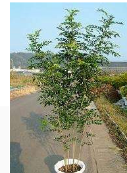
トネリコ (モクセイ科)常緑