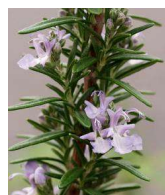
ローズマリー (シン科)常緑