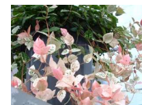
初雪カズラ (キョウチクトウ科)常緑