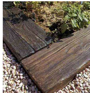
枕木風の擬木を使った小道