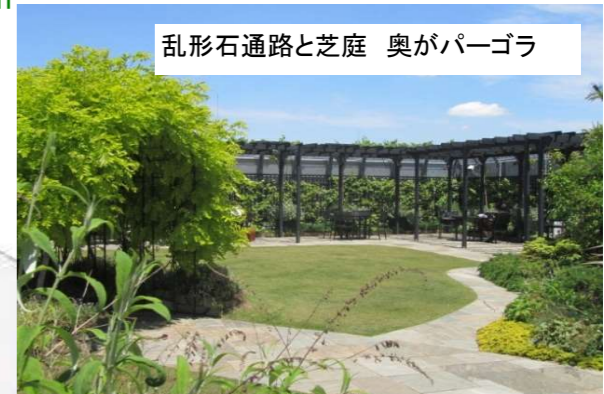
乱形石通路と芝庭 奥がパーゴラ

＝奨励モデル型建築物緑化助成制度＝ 条件1:緑化可能面積の2/10以上の緑化 条件2:最低緑化面積80㎡ 条件3:工事費の1/2 条件4:上限500万円