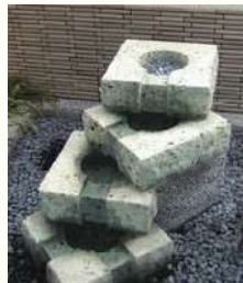
■カスケード(4個使用)