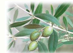
オリーブ (モクセイ科)常緑