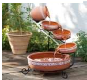
水循環式 ファウンテン