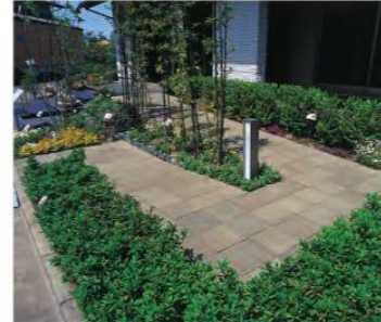
ブロックテラス(リビオ)