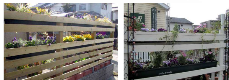
ウッドフェンス(防腐処理済み材)

■GSTR-AR01 317967 G-story ローズアーチ 約W1310×D400×H2500(埋込杭含む)mm 約7.5kg 開口:約W1120×H2070mm カラー:ブラック 埋込杭付 * ¥15,000/台 ※地中に約20cm埋めてお使い ください