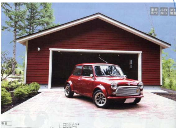
石畳風ブロック敷き(カシア)