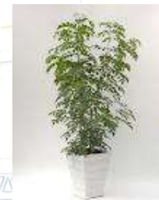
■「シマトネリコ」 モクセイ科常緑広葉樹