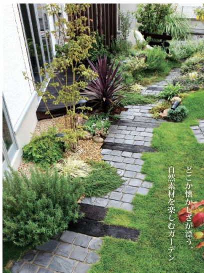
どこか懐かしさが漂う 自然素材を採らむガーデン