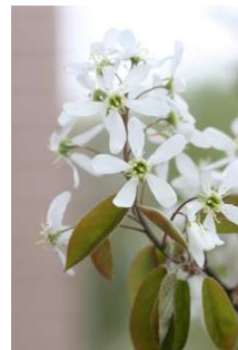
「エゴノキ」 エゴノキ科 落葉広葉樹