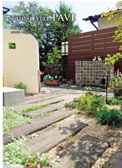
RAIL SLEEPER PAVE