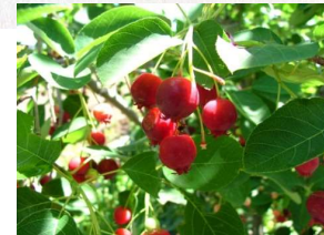
「ジュンベリー」 バラ科落葉広葉樹