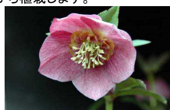
クリスマスローズ オリエンタリス(キンポウゲ科)