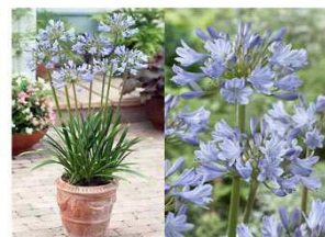
小型アガパンサス(ユリ)