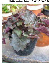
ツボサンゴ (ユキノシタ科)