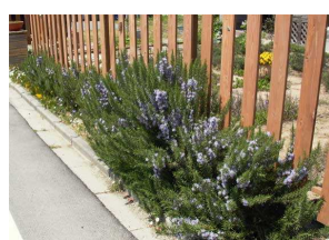
ローズマリー (シソ科)