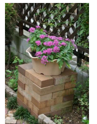
<狗犬はレンガ花台の上に>