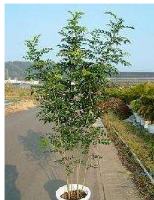
■シマトネリコ 常緑高木 (モクセイ科)

注意: ご覧いただいている図は、イメージですので、出来上がりに多少誤差がございます