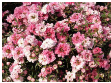
ギョリュウバイ (フトモモ科 常緑小低木)