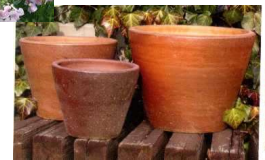
<狗犬イメージに合わせた鉢に季節の一年草>