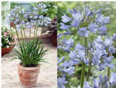
小型アガパンサス(ユリ)