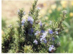
ローズマリー(シソ科)