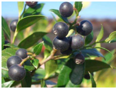
ワイルドブルーベリー (ツツジ科)