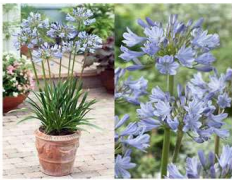
小型アガパンサス(ユリ)