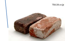
<アンティーク耐火煉瓦の飛び石>