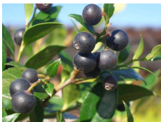
ワイルドブルーベリー (ツツジ科)