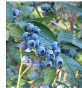
ブルーベリー (つつじ科) 落葉低木