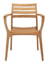
ロータス アームチェア ¥35,000X1