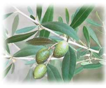
■オリーブ モクセイ科常緑中高木