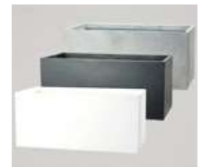
■ファイバーポット80 外寸 W100×D45×H45cm 重量 22kg 価格 29,000円