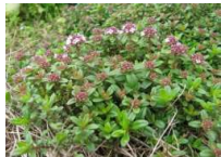
クリーピングタイム (シン科) 常緑地被