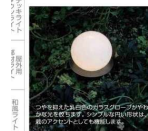
ロータス12の4Vラインで電球のほかにLED電球も使えます。LED電球は省電力で寿命も長いです。また、LED電球は色温度も選べます。また、LED電球は色温度も選べます。また、LED電球は色温度も選べます。