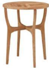
ロータステーブル60 ¥38,500X1