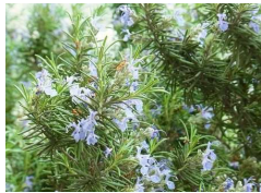
ローズマリー (しそ科) 常緑低木