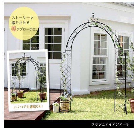
メッシュアイアンアーチ