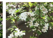
姫りんご(バラ科) 落葉高木