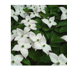
ヤマボウシ(ミズキ科) 落葉高木