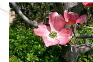
花水木(ミズキ科落葉高木)