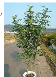
シマトネリコ (モクセイ科)

※時期や入荷状況により、植栽や価格や種類は変更となります。 こちらのイメージから、お好みの植栽・材料等をお知らせください。