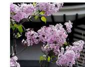
ライラック(モクセイ科) 落葉高木