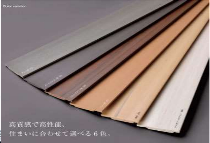
高質感で高性能、 住まいに合わせて選べる6色。