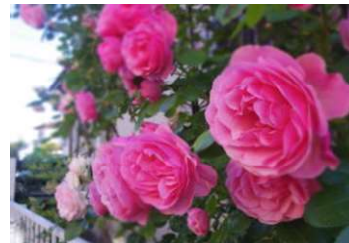
「レオナルドダヴィンチ」