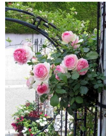
「ピエール ドウ ロンサール」