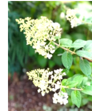
●ノリウツギ (ユキノシタ科) 落葉低木