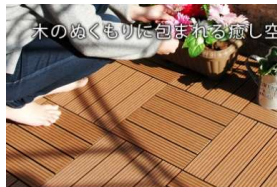
■樹脂木 ウッドパネル