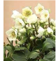
●クリスマスローズ (キンポウゲ科) 常緑多年草