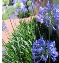
●細葉アガパンサス (ユリ科)常緑多年草