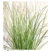
●カレックス (カヤツグサ科) 常緑多年草