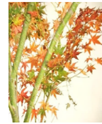
●イロハモミジ(カエデ科) 落葉広葉樹中高木