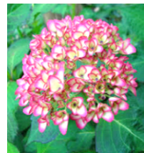
●アジサイ (ユキノシタ科) 落葉低木