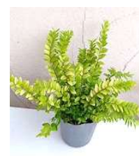
●ロセダニチカ (ズイカズラ科)常緑低木