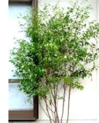
●ハイノキ(ハイノキ科) 花木4~5月 常緑広葉樹高木