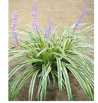
●斑入りヤブラン (ユリ科) 常緑多年草