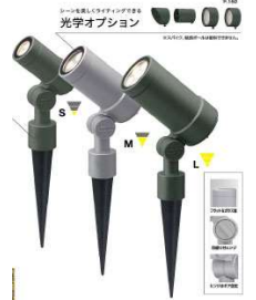
■光学オプションあり アップライトS中角 2700K ¥33,000 3.2W