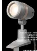
■調光可能アップライト 2700K~5000K 6.6W 2700K 2~8W ¥44,000