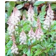
●ティアレア(ユキノシタ科) 落葉多年草