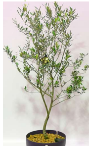
■既存オリーブ(モクセイ科) 常緑広葉樹中高木