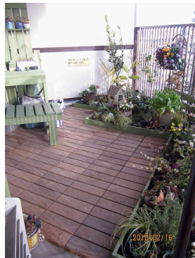
■天然木 ウッドパネル