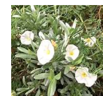
●コンボルプス(ヒルガオ科) 落葉多年草