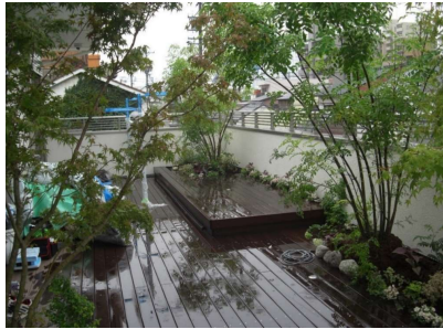
■アマゾンジャラと紅葉