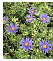
●細葉ブルーデージー (キク科)常緑多年草