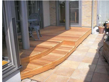
■ムイラカチアラ R加工