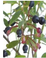
●ビルベリー (ツツジ科) 落葉低木