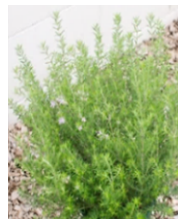
●ウエストリンギア (シソ科)常緑低木