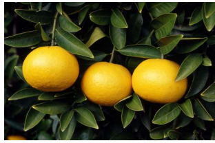
■八朔(ミカン科) 常緑中木