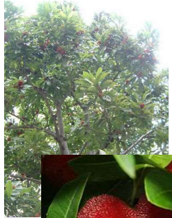
■ヤマモモ(ヤマモモ科常緑広葉樹)