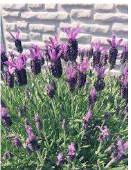
■ラベンダー (シソ科)常緑低木