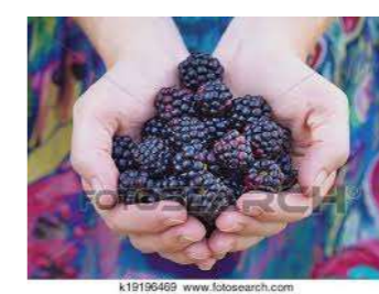
■ブラックベリー(バラ科) 落葉低木