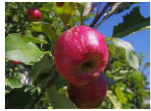
■リンゴ<アルプス乙女>(バラ科) 落葉高木