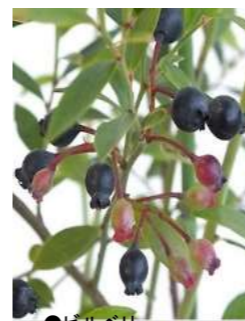
●ビルベリー (ツツジ科) 落葉低木