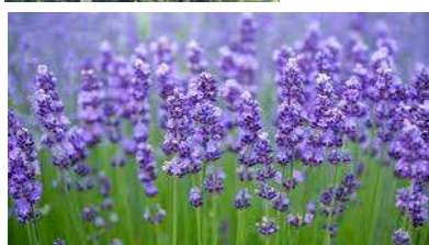
●アジュガ(シソ科) 常緑宿根草