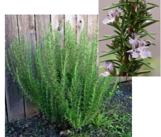
■ローズマリー (シソ科)常緑低