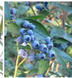
■ブルーベリー (つつじ科) 落葉低木