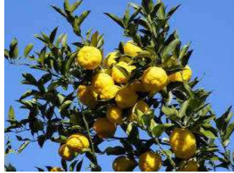
■ゆず(ミカン科) 常緑中木