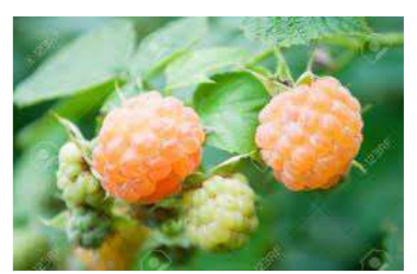
■ラズベリー(バラ科) 落葉低木