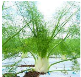
■フェンネル (セリ科)常緑宿根草