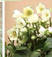
●クリスマスローズ (キンポウゲ科)常緑多年草