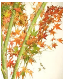
●クマノミ(カエデ科) 落葉広葉樹中高木