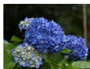
●アジサイ (ユキノシタ科)落葉低木