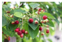
■ジュンベリー(バラ科)落葉高木