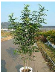
■シマトネリコ (モクセイ科)常緑