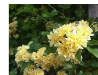
●木香バラ(バラ科) 半常緑つる性低木 花4-5月