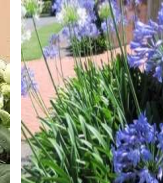
●細葉アガパンサス (ユリ科)常緑多年草