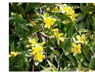
●カラライナジャズミン (マチン科)半常緑つ