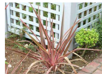
●ニューサイラン(リュウゼツラン科) 常緑宿根草