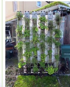
■エスバリアフェンス 緑化イメージ